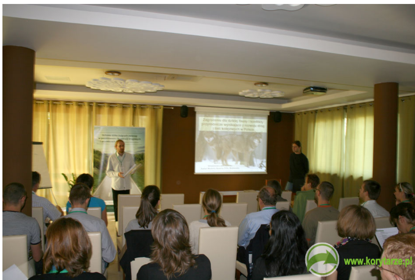
Sesja szkoleniowa - referat IBS PAN w Białowieży.

25-27 czerwca 2009 r. odbyło się szkolenie „Ochrona dziko żyjących zwierząt w projektowaniu inwestycji drogowych i procedurach ocen oddziaływania na środowisko - problemy i dobre praktyki” dla pracowników biur projektowych i planistycznych.